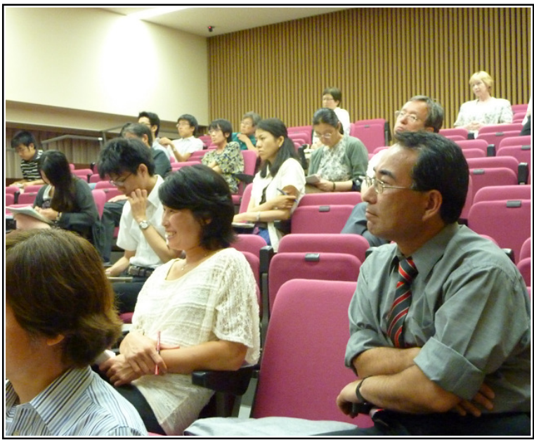
フロアも交えての歓談