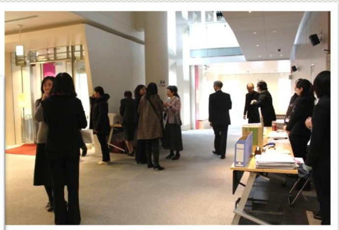
コーヒーサービス