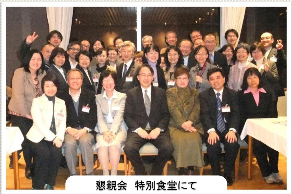
懇親会 特別食堂にて