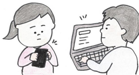
ソーシャルメディア