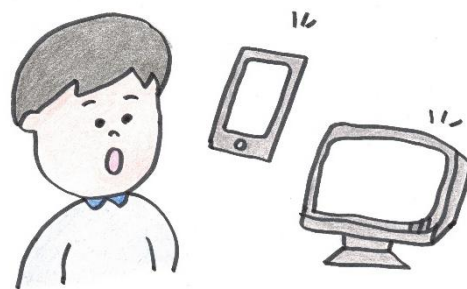
フェイクニュース