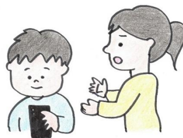
エコー・チェンバー