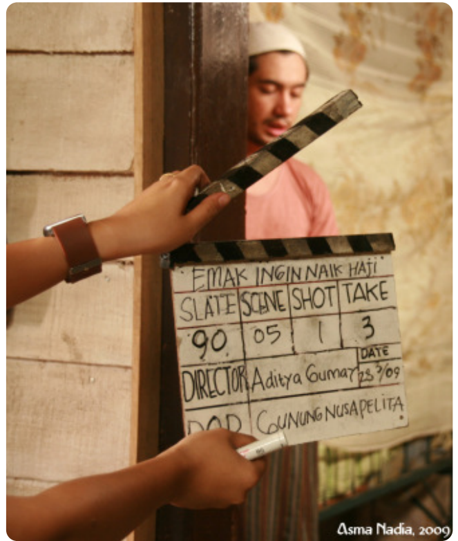
Asma Nadia, 2009