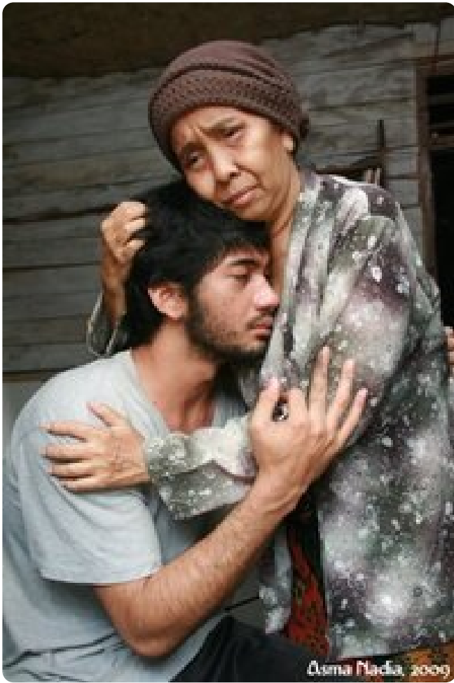
Asma Nadia, 2009