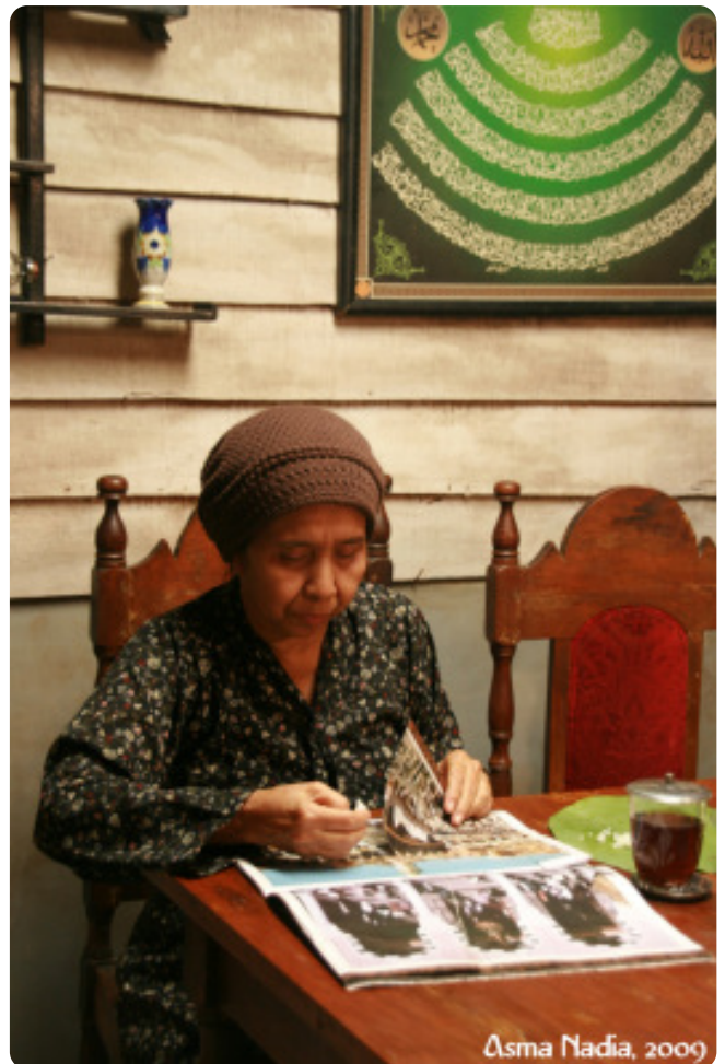
Asma Nadia, 2009