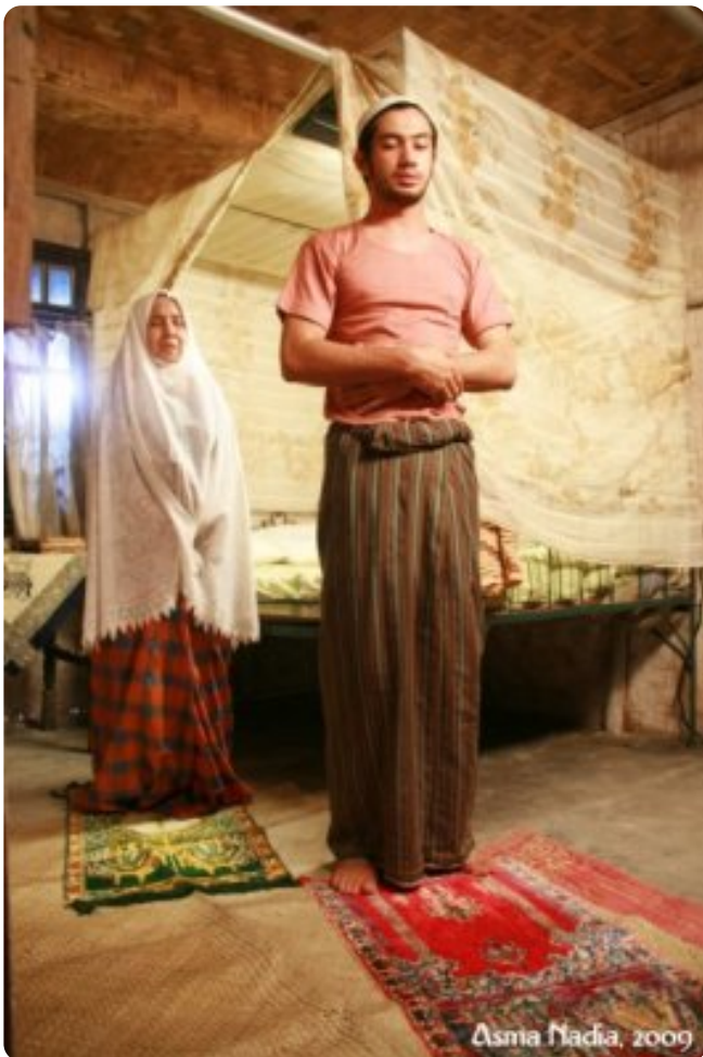
Asma Nadia, 2009