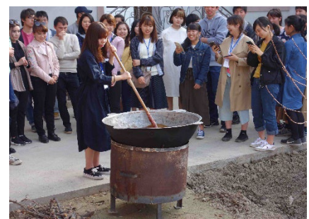
<ショートビジット(ウズベキスタンサマルカンド経済サービス大学)>

・Global Japan Office(ボアジチ大学(トルコ)へ設置予定)やGlobal Japan Desk(タシュケント東洋国立大学(ウズベキスタン)等へ設置予定)の着実な拡充を進めます。