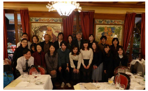
<TUFSGローバル・コミュニティ会合(パリ)>

・TUFSGローバルコミュニティ会合を、ベネチア、シドニー、メルボルン、パリ、マドリードの5か所で開催した。このうち、パリ会合には、フランスや隣国に留学中の在校生8名、パリなどで活躍する卒業生11名の総勢20名で開催され、世代を超える交流を通し、フランス内での本学ネットワークを更に深化させる会合となった。