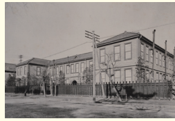
独立当時(1899【明治32】年)、高等商業学校の運動場に建設された校舎(神田路3丁目14番地) 1899: The school building was built on the athletic field of the Tokyo Commercial School (3-14 Kanda Nishiku-cho).