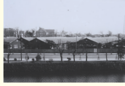
1924 (大正13) 年、焼失した元衛町の校舎に代わり新築された仮校舎(麹町区竹平町1番地) 1924: The temporary school building was built to replace the school building in Motoe-cho, which was destroyed by fire (1 Takehira-cho, Kojimachi-ku, Tokyo).