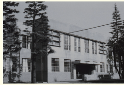
1946 (昭和21) 年、青山中学校校舎の一部を借用(板橋区上石神井1丁目216番地) 1946: The leased part of the Chitan Junior High School building (1-216 Kamishakujii, Itabashi-ku, Tokyo).