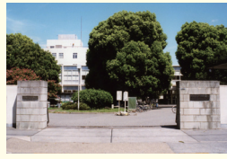
1949 (昭和24) 年、戦災で失われた西ヶ原校舎を復旧し、移転。1950年にはコンクリート校舎が建設(北区西ヶ原) 1949: The school building in Nishigahara, which was rebuilt and relocated after being lost in the war. A concrete university building was also built in the 1950s (Nishigahara, Kita-ku, Tokyo).