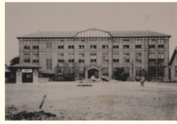
1921 (大正10) 年、麹町区元衛町1番地に完成した新校舎 1921: The new school building completed at 1 Motoe-cho, Kojimachi-ku, Tokyo.