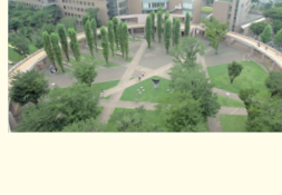
2023 (令和5) 年、建学150周年 2023: The 150th anniversary of the founding of TUFS.