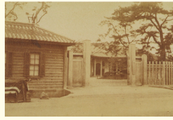
1873 (明治6) 年、神田一ツ橋通町校舎 1873: Kanda Hitotsubashitoricho School Building.

Tokyo University of Foreign Studies has a long history. Its origins are traced to Bansho Shirabesho (Institute for Research of Foreign Documents), established by the Edo Shogunate in 1857.