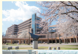
2000 (平成12) 年、現在の府中キャンパスへ移転(府中市朝日町3丁目) 2000: The current Fuchu Campus (3 Asahi-cho, Fuchu City, Tokyo) following the move to Fuchu in 2000.