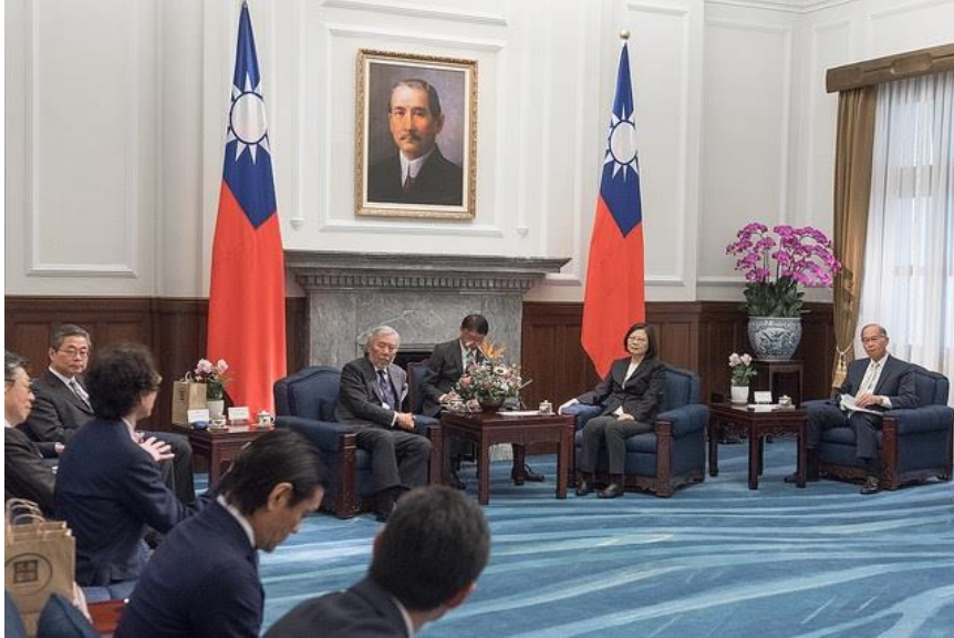
2018年5月 筆者有幸能跟蔡總統見面並提問