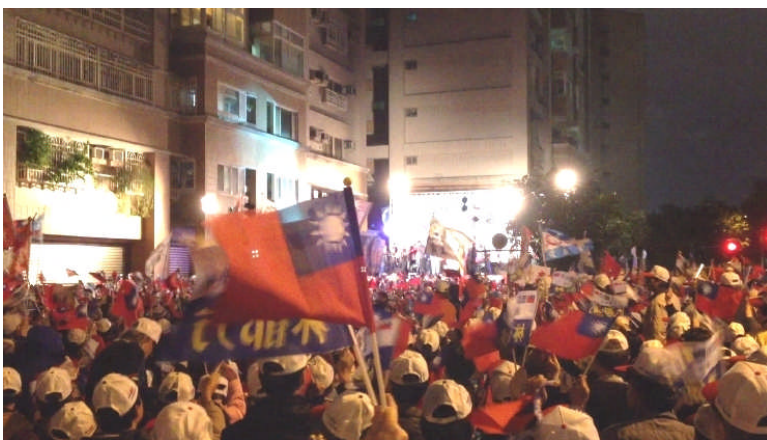
選戰最後階段馬英九在台北市萬華區舉辦的造勢晚會中演講。這顯示馬英九的氣勢恢復。(2012年1月12日，福田圓攝影)