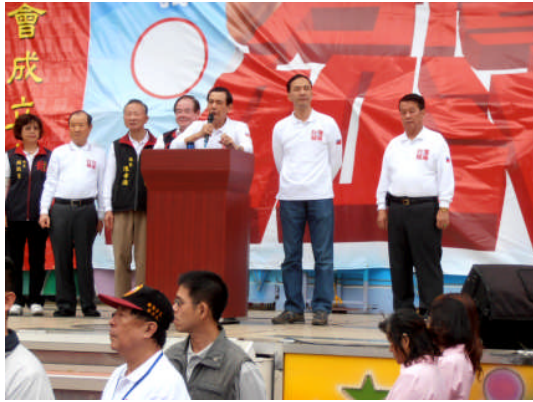
國民黨候選人馬英九在新北市三重區舉行的造勢活動演講。(2011年11月26日)