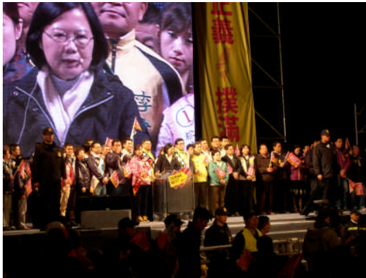
選戰尾聲階段民進黨候選人蔡英文在台北市士林區舉辦的造勢晚會中演講。這場晚會被台灣媒體視為一場成功的盛會。蔡英文登場的時候，聽眾熱烈歡迎，但是30分鐘的演講還在進行之中會場後面的聽眾陸續離開。這顯示蔡英文的人氣鬆散。(2011年12月25日，小笠原欣幸攝影)