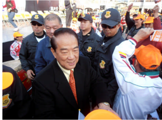
親民黨候選人宋楚瑜參加在苗栗縣公館舉行的造勢活動。(2011年12月25日)