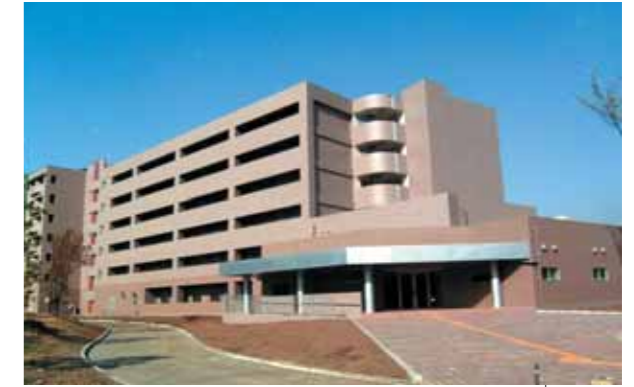
● 国際交流会館(1号館・2号館)