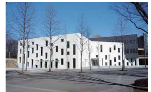
● アゴラ・グローバル

プロメテウス・ホール等で様々な学術国際会議やオープンアカデミー、地域社会との交流等に使用できるとともに、本学のグローバル・キャンパスの実現に向けた中核となる施設です。また、1階にはカフェ・コーナーが設けられています。