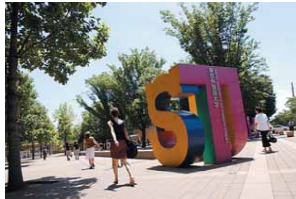
● 北アライバルコート

全国にある国立大学(法人)のなかでもっとも快適な大学の一つが東京外国語大学です。2004(平成16)年秋に朝日新聞社が全国156大学に対して行った好感度調査で、本学は私立、公立を含めた全大学中4位、国立大学法人ではじつに第1位という結果を得ました。評価は、講義やゼミの中身、図書館、食堂など施設面を含め、総合的に評価されるものです。また、2009(平成21)年には府中市の府中景観賞を景観創出部門にて受賞しています。2000(平成12)年10月、東京都北区西ヶ原から現在の府中キャンパスへ移転事業を開始、2010(平成22)年4月に、アゴラ・グローバルが新たに仲間入りしました。文字通り、「対話と交流をベースとして世界に開かれたキャンパス」の誕生です。アヴァンギャルド風のデザインと武蔵野の森を調和させた新しい空間は、21世紀グローバル化時代を生き抜く新しい知性を育てる上でこの上なく理想的な環境といえます。