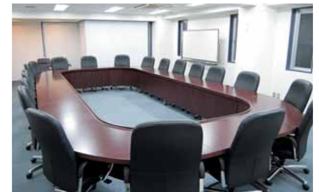
● 7F 会議室