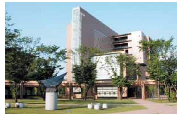
● アジア・アフリカ言語文化研究所