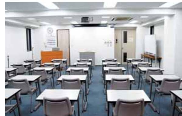
● 3F 講義室

また、2004(平成16)年の法人化を機に、館内設備の充実を図りました。皆様のご利用をお待ちしています。