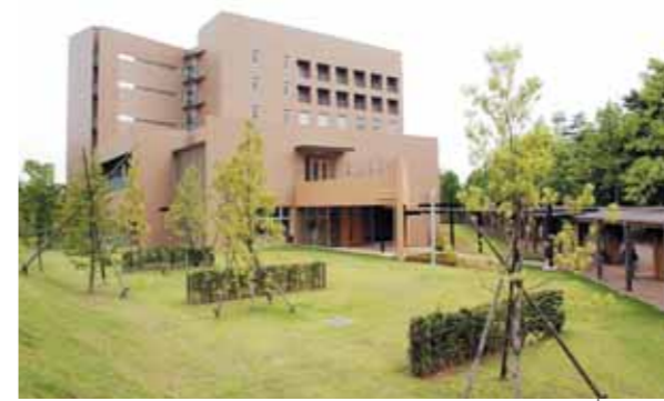
● 留学生日本語教育センター