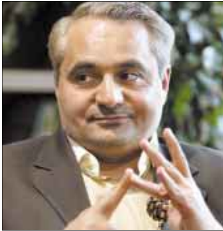
سید حسین موسویان