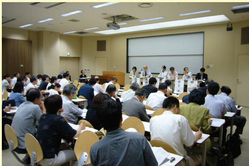
シンポジウムの様子 約150人の方の来場がありました