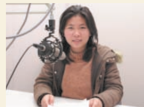
▲カンボジア語教材の録音スタジオで

生まれて初めての外国生活も半年がすぎました。高校生のころ、先生や友人たちから、日本は先進国で教育水準も高いから、留学選抜にはカンボジア全国から数多くの受験生が集まりとても難しい試験が行われると聞きました。高校3年のときに先輩が日本に留学することになって、ますます関心が高まりましたが、自分の希望が実現するとは思っていませんでしたので、留学試験の合格発表を見たときはとても信じられず、夢をみているのではないかと思いました。このときの気持ちはとてもことばでは言い表せません。