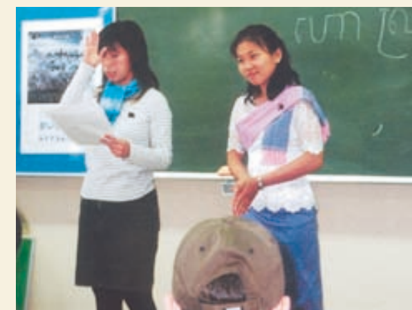
▲カンボジア語1日体験講座で