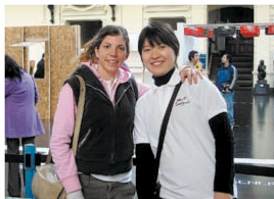
▲国際交流事業でチリの青年と。