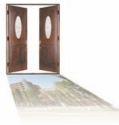
教授 水林 章