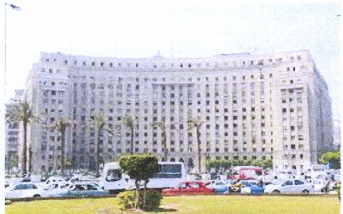
↑カイロはタハリール広場に建つ合同庁舎が舞台