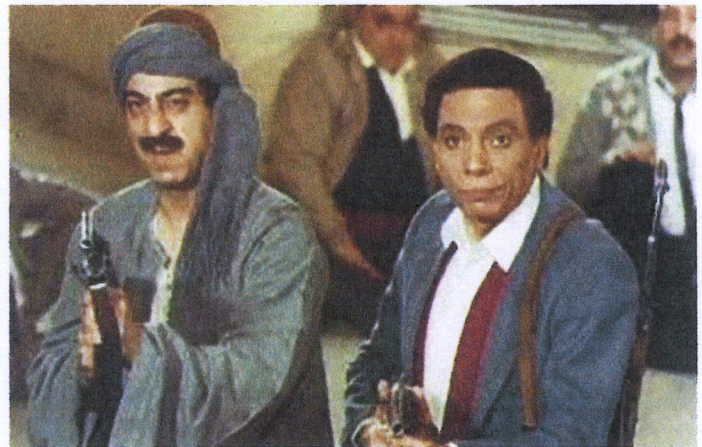
↑アーデル扮する一般市民（右）と援護に加わった男

一般市民の男性が、子どもの転校手続きのために政府合同庁舎へ。仕事をしない職員と小競り合いとなり、駆け付けた警備のライフルが暴発したことから、人質を取って庁舎へ籠城するテロリストと誤解される。公務員や高級官僚などの横暴を風刺すると同時に、不満を持ちながら声を上げない国民の姿をも風刺したコミック映画。