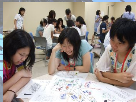
昨年のセミナーの様子