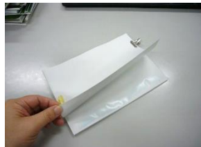
のりを付けた状態