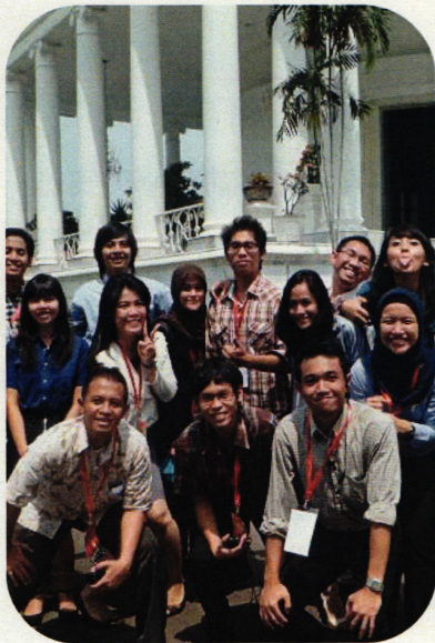
昨年のEROPA会議(インドネシア・ジャカルタ)で参加者を案内する現地学生ボランティアスタッフ

来秋、アジアを中心とした世界各国から立川市へ集まる海外の要人をもてなし、一緒に国際会議を運営しませんか。