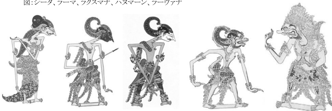
図:シータ、ラーマ、ラクスマナ、ハヌマーン、ラーヴァナ

(以下第7巻)国民の間にシーターの貞操を疑う声が生じ、ラーマはシーターを森に追放する。シーターはヴァールミーキ仙の庵に滞在し、クシヤとラヴァの双子を産む。ヴァールミーキ仙は二人に『ラーマーヤナ』を語って教える。それを聞いたラーマは二人が自分の子どもであることを認める。ラーマがシーターに身の潔白を証明するよう求めると、シーターは大地の女神を呼び出し、女神に抱かれて地中に消える。嘆き悲しむラーマは王位を息子たちに譲り、天界に昇ってヴィシュヌ神に戻る。