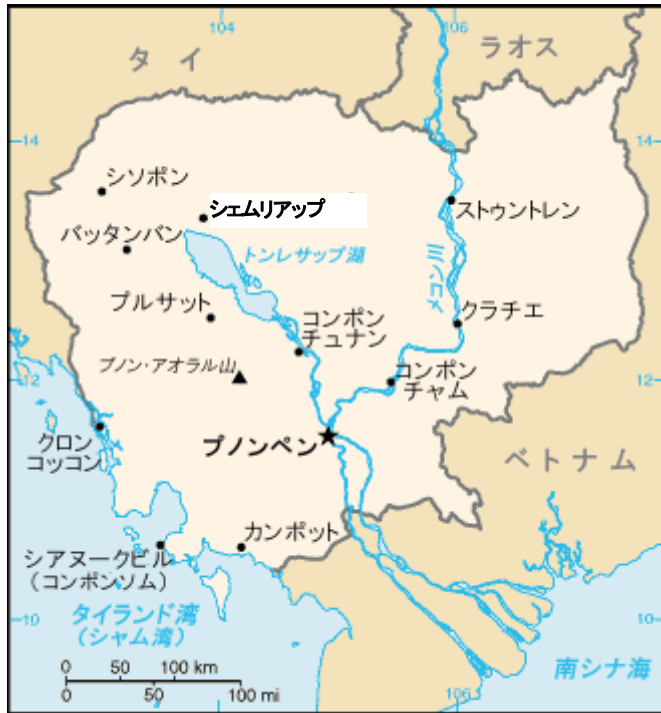
図1 (左) カンボジア 図2 (下) アンコール全体 ① アンコールワット (寺院) ② アンコールトム (王都) ③ 西バライ (人工池) ④ 東バライ