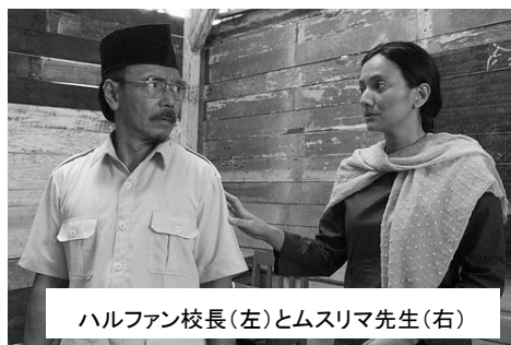
ハルフアン校長(左)とムスリマ先生(右)