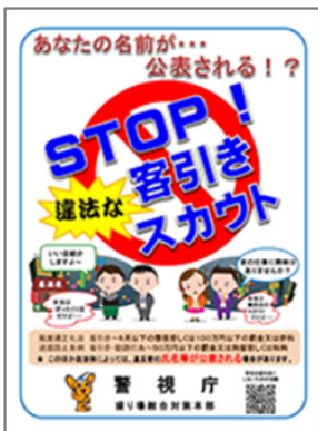
違法客引き等防止ポスター

警視庁では、出張講話、ポスターの掲示依頼のほか、啓発動画など各種広報資料を作成して情報発信をしておりますのでご活用をお願いします。