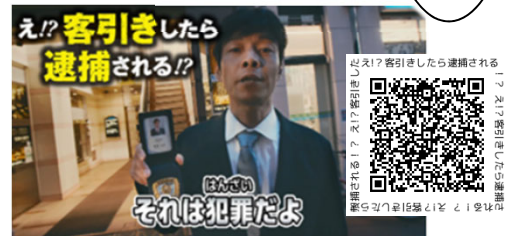
違法客引き等防止啓発動画(15秒)

また、警視庁HPへ各大学等HPからのリンク等、防犯広報へご協力もお願いいたします。